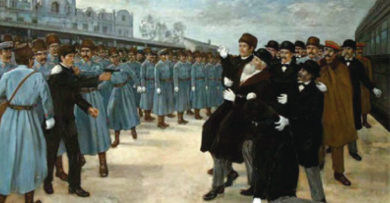
안중근 하얼빈의거 장면도(박영선 화백) Сцена праведного дела Ан Джунгына на Харбинском вокзале (художник Пак Ёнсон)

“안중근 의사는 하얼빈 정거장에서 일본 군벌의 시조인 이등박문을 총살하여서 세계 안목을 놀라게 하였다. 이 사변에 대한 재정 권총 기타가 모두 최재형의 재정이었다.