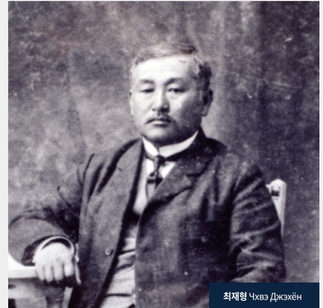
최재형 Чхвэ Джэхён

1860년 8월 15일 함경북도 경원에서 태어난 최재형은 1869년 가족과 함께 러시아 지신허로 이주하였다. 러시아 상선 선장 부부의 도움으로 러시아어를 교육받았고, 상선의 선원으로 러시아와 유럽 여러 나라의 문물들을 경험하였다. 이후 통역을 비롯하여 러시아군에 우육을 조달하는 축산유통업과 도로·건물을 건설하는 건축업 등으로 재산을 모아 러시아 정치·사회·경제 방면에서 활동하여 큰 영향력을 가지게 되었다. 니콜라이 2세의 대관식에 참석하였을 뿐만 아니라 러시아 정부로부터 여러 개의 훈장을 받았으며, 러시아 크라스키노(연추)지역을 책임지는 도현으로 임명되기도 하였다. 최재형은 이러한 입지를 바탕으로 의병활동, 언론활동, 교육산업, 권업회 등 다양한 항일활동을 전개하였다.