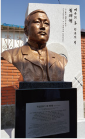
최재형 기념비 Памятник Чхвэ Джэхёна

Чхвэ Джэхён жил в этом доме с 1919 г. до момента пожертвования своей жизни за родину. Поэтому, в марте 2019 г. этот дом был открыт как Мемориальный зал Чхвэ Джэхёна, где можно ознакомиться с его жизнью и движениями за независимость.