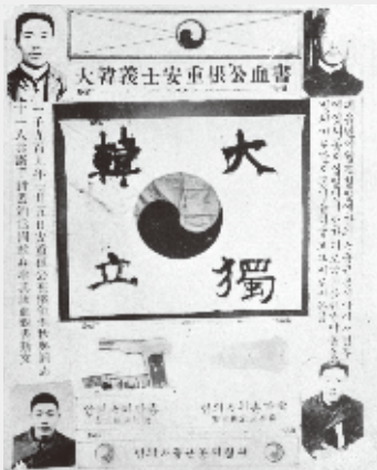
안중근 단지혈서 기념엽서 Памятное послание Ан Джунгына, которое он написал своей кровью