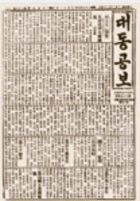
대동공보 Газета “Дэдон Конбо

В 1909 г. Ан Джунгын и ещё 11 его единомышленников создали радикальное тайное общество на конспиративной встрече в Ёнчху. Они собрались дома у Чхвэ Джэхёна и, отрезав часть безымянного пальца левой руки, кровью написали на листе бумаги клятву пожертвовать жизнью ради восстановления независимости и процветания Родины.