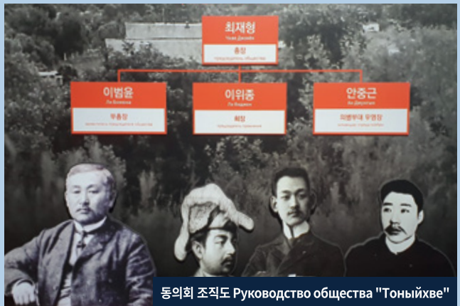
동의회 조직도 Руководство общества "Тоныйхве"