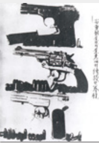
안중근 권총 Пистолет Ан Джунгына