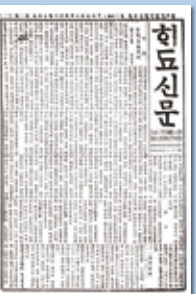
해조신문 Газета «Хэджо Синмун»

최재형은 1908년 이범윤, 이위중, 안중근 등과 동의회를 조직하였다. 군자금은 최재형과 이위중이 각각 1만 3천 루블과 1만 루블을 지원하였고, 수청 지방에서 6천 루블을 모금하여 충당하였다. 총기는 군납을 하던 러시아 부대에서 구입하였고, 각지로부터도 총기 100정을 구입하였다. 준비를 마친 동의회는 국내 진공작전을 전개하여 안중근이 이끄는 의병부대는 1908년 7월~ 9월에 걸쳐 함경도 경흥, 경원, 신아산, 회령 등지에서 일본 군과 전투를 벌여 승리하였다. 그러나 일본군의 우세한 화력과 수적인 열세로 퇴각하였다.