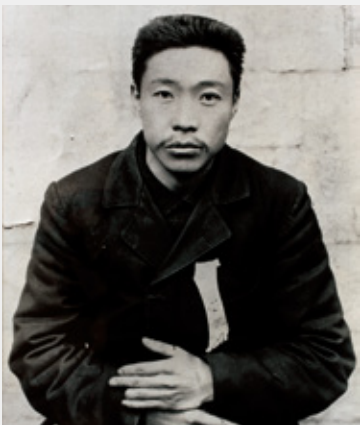
안중근 의사 Патриот Ан Джунгын

-Навек сохраним память о нём - об Ан Джун гыне!