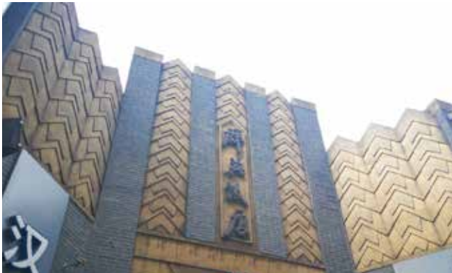
청태 제 2여관(군영호텔) 清泰第二旅社(群英饭店)