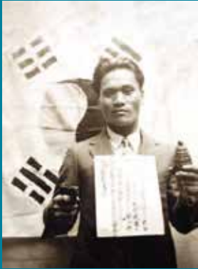
의거 직전 수류탄과 권총을 들고 태극기 앞에 서있는 윤봉길 의사 尹奉吉义举之前手持手榴弹和手枪在太极旗前留念