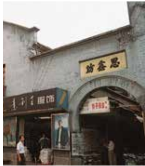
한국독립당 본부가 있었던 사옹방 입구 韩国独立党本部的思翁坊入口