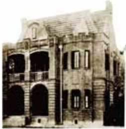
중국 상해에 수립된 대한민국임시정부 청사 초기의 모습 初期大韩民国临时政府在上海

大韩民国临时政府是韩国历史上第一个民族共和政府，作为抗日独立运动的主要领导机构发挥了重要的作用。1932年转移至杭州前，大韩民国临时政府一直以上海为大本营，前后活动了13年，是后来大韩民国政府成立的根源。