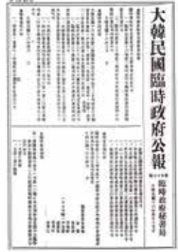
임시정부가 항저우에 머물던 시기에 발행한 '대한민국임시정부공보' 제57호 (1934. 4. 15) 临时政府在杭州避难时期发行的《大韩民国临时政府公报》第57号 (1934.4.15.)

大韩民国临时政府迁徒到杭州后, 于1932年5月15日~16日在杭州召开国务会议。会议重新调整国务委员的工作分工并明确了各自职责, 在外交、财政、军事等各个方面充分地履行了独立运动最高机关的作用。1933年5月, 金九和蒋介石举行会谈, 临时政府开始得到中国国民政府的支持, 加强联合东亚地区的抗日势力。同时, 临时政府为改善薄弱的财政状况, 于1934年4月作出了《财务部行署规定》, 将从在美韩侨处所募集的资金用来补充独立运动财政资金。临时政府坚持履行政府和议会的职责, 唤醒了旅居国外韩侨们的民族精神和抗日斗志。