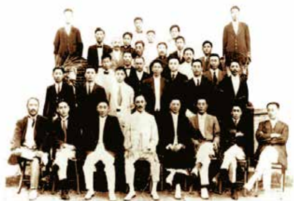
임시정부의 통합을 이룬 제6회 임시의정원 의원(1919. 9) 统一临时政府的第六次临时议政院议员纪念照 (1919. 9)