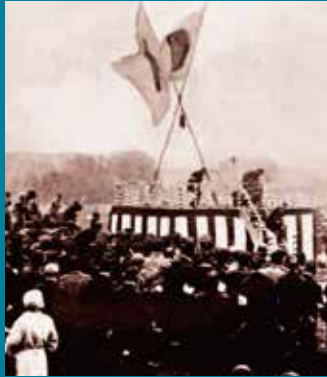
윤봉길 의사 의거 직후의 홍구공원 尹奉吉义举之后的虹口公园

尹奉吉义举后, 大韩民国临时政府离开了根据地上海, 经杭州、长沙、广州、綦江等地, 于1940年到达重庆。