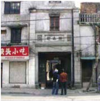
장생로 55호(호변촌 23호) 长生路湖边村23号