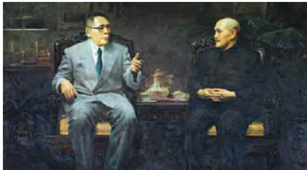
김구와 장개석의 회견(한국 백범기념관 소장) 金九和蒋介石的会见(油画在韩国白凡纪念馆收藏)